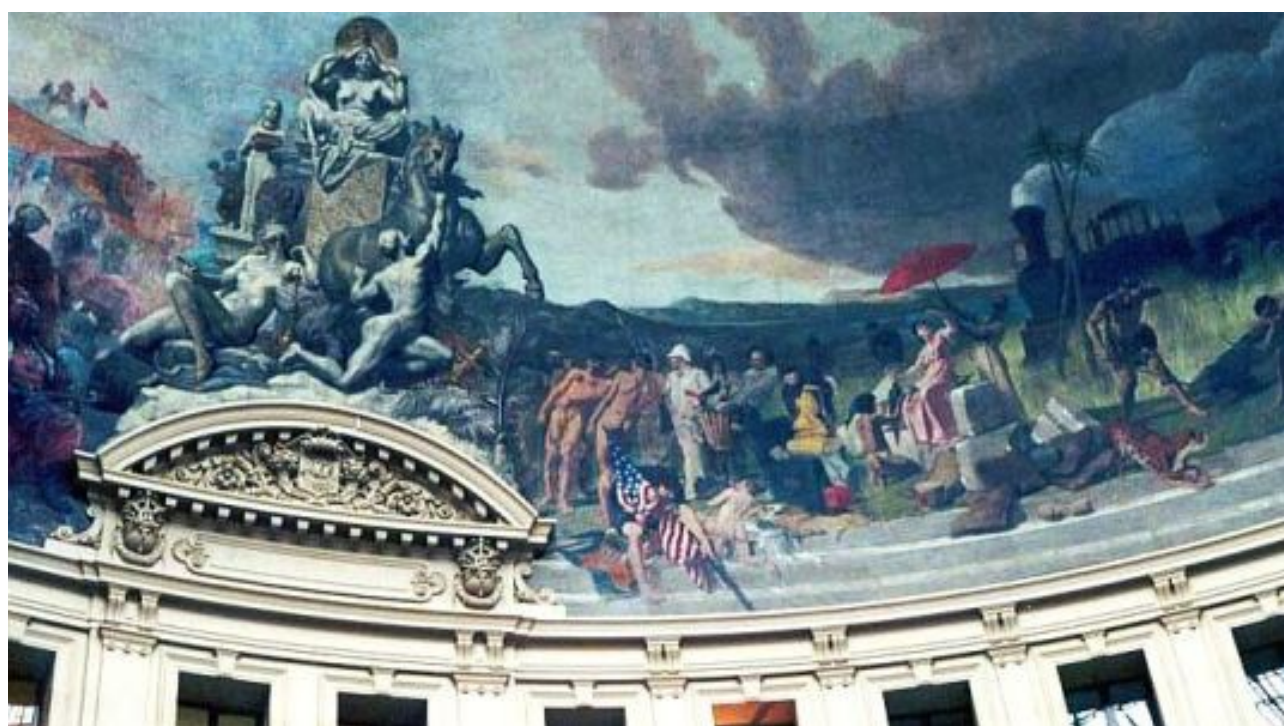
Coupole : vue intérieure (partielle)

AAO – ONERA BP 72 – F 92322 CHATILLON CEDEX– Tél.01 46 73 37 78