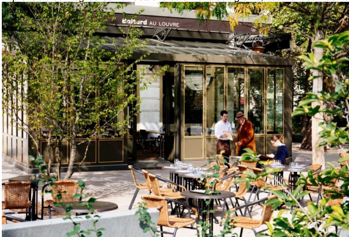
Baltard Au Louvre

Un cadre exceptionnel : avec un grand bol d'air en plein cœur de Paris Les anciennes halles qualifiées de Ventre de Paris ont laissé place à des jardins, mais Baltard est toujours là ! Notre établissement typé art déco ouvre sur les jardins de la Canopée et propose une vue imprenable sur l'église Saint Eustache et la Halle aux grains, bâtiment du 16ème siècle.