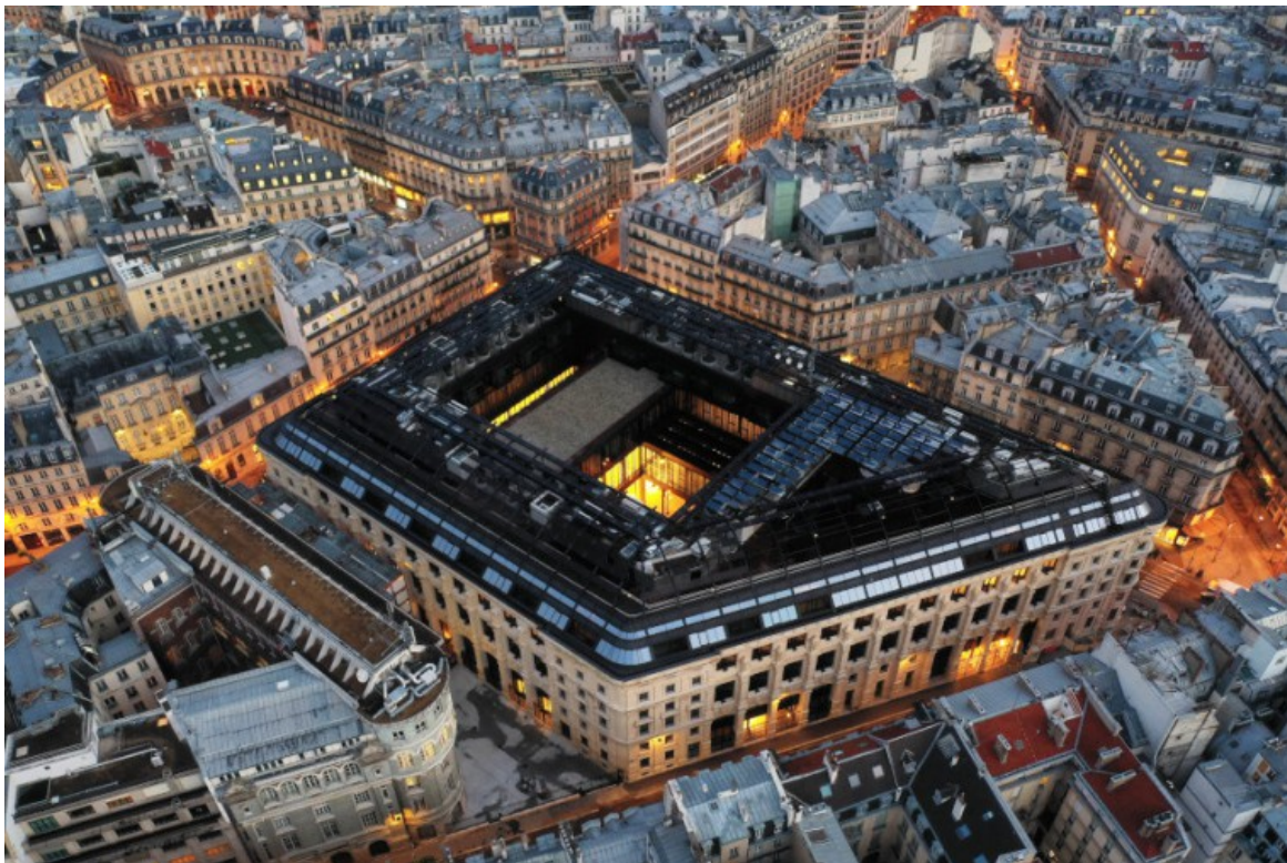
La Poste Paris Louvre

La Poste du Louvre s'ouvre désormais à la ville et aux passants. A l'instar des fameuses galeries voisines Vivienne ou Véro-Dodat, 5 ouvertures couvertes permettent d'accéder au patio central de cet édifice depuis les rues du Louvre, Jean-Jacques Rousseau, Etienne Marcel et le passage Gutenberg, nouvelle voie créée au sein du projet. Les visiteurs ont accès au rez-de-chaussée à de nombreux commerces. Ce nouvel écrin a été repensé pour accueillir une véritable mixité des usages. Il comporte dans ses murs un large éventail d'activités et ponctuellement des évènements culturels animent ce lieu emblématique