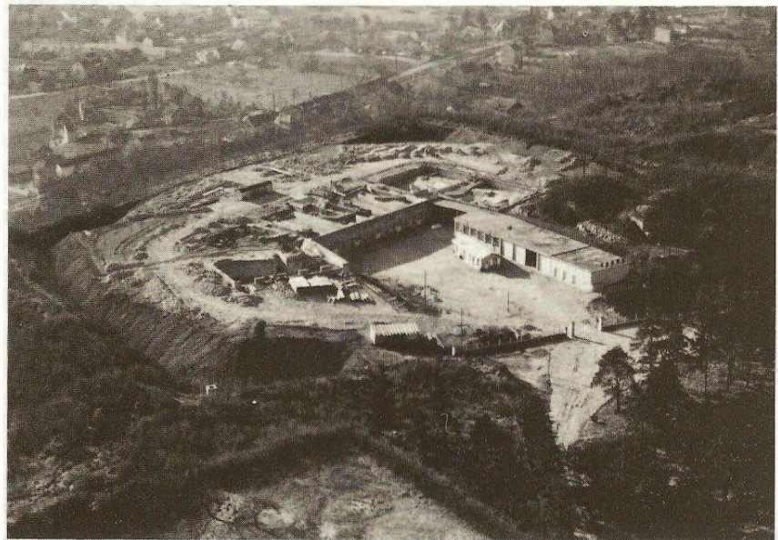
Le Fort avant 1946

" La cantinière militaire établie au fort vend à boire et à manger aux ouvriers civils employés aux travaux de construction. La position particulière qu'elle occupe lui permet de nous faire, à nous logeurs, une concurrence impossible à soutenir "